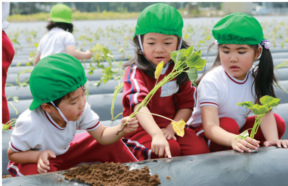
さつまいも苗植体験

また、令和3年度には同JA女性部と連携し、社会福祉施設に手作りの床ずれ防止クッションを寄贈しました。