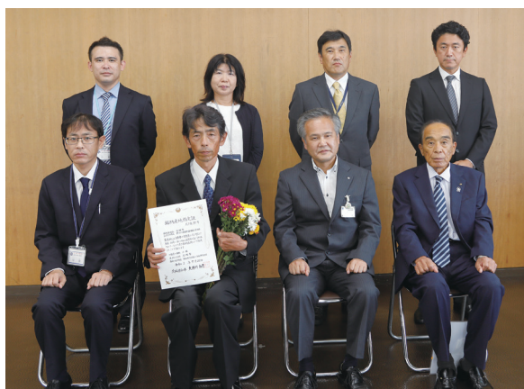
花卉（小菊）銘柄産地交付式

また、新型コロナウイルスによる緊急事態宣言でイベント中止などが相次ぎ、カーネーションを中心に大幅に価格が下落したことから、令和2年4月に、役職員による消費拡大運動に取り組みました。