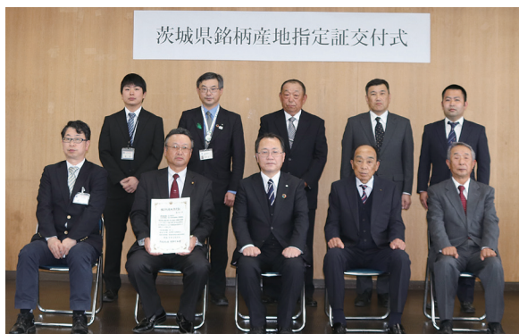
石岡地区梨部会 銘柄産地指定