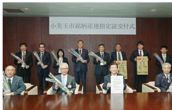
美野里にら部会 銘柄産地指定