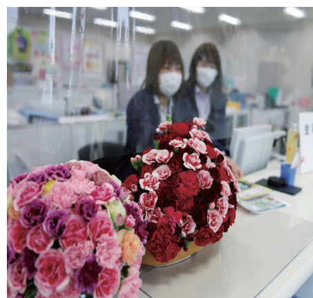
役職員による花卉農家支援