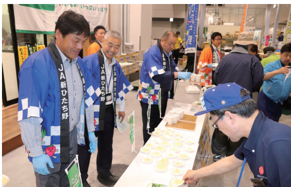
トップセールス（豊洲市場）

一方、令和3年2月、事業基盤を強化するために営農経済委員会を重ね、各部会および販売手数料の統一化を図りました。