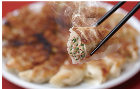
にらたっぷり肉餃子