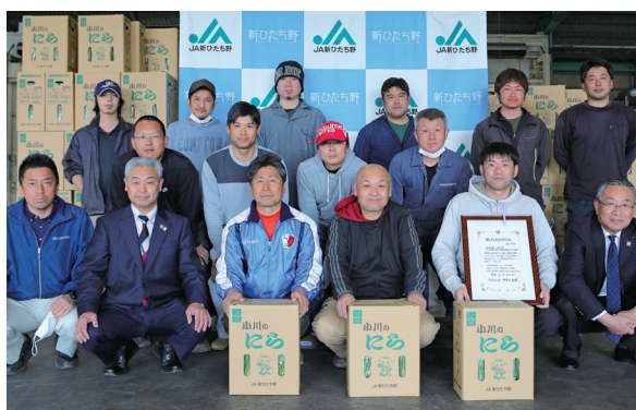
小川にら部会 銘柄産地指定