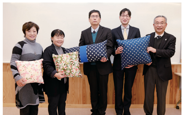
社会福祉施設に床ずれ防止クッションを寄贈