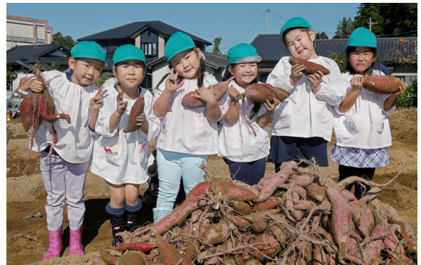
さつまいも収穫体験