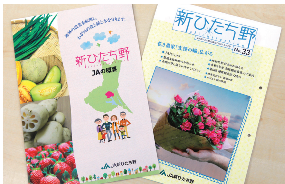
准組合員向けリーフレット