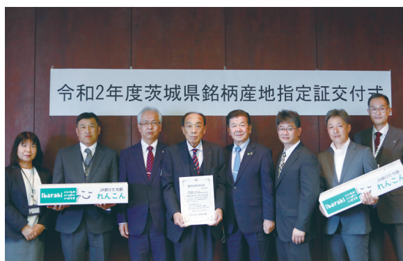
れんこん部会 銘柄産地指定